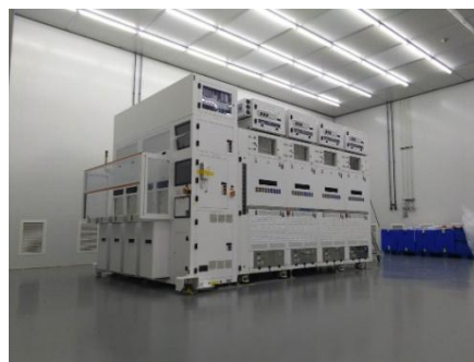
（S300 单片式设备实物图）